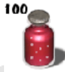
100 フルヒーリング ポーション