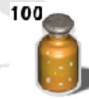
100 フルリカバリー ポーション